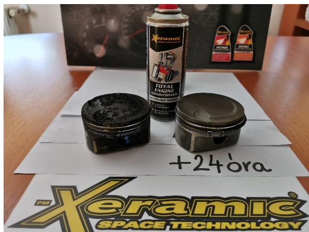
Total Engine Conditioner hatása 24 óra alatt

50-60 % -al csökkenthető bármely motor károsanyag kibocsájtása (CO, k), melyből az üzemeltető előnyei az egyenletes alapjárat, jobb gázreakció, nagyobb teljesítmény, továbbá egyértelműen alacsonyabb olaj-, üzemanyag fogyasztás. A motor tisztán tartásának hatékonysága tovább növelhető a legtöbb autógyártó által elismert, és elő is írt minőségi befecskendező tisztító üzemanyag adalékok használatával. A 20122 Xeramic Injector Cleaner és 20119 Petrol Injector Cleaner termékeink hatékonyságát többek között az Opel AG beszállítói szinten is elismeri, és kötelező jelleggel elő is írja karbantartások során szervizei számára. A leírtak alapján a fenti kérdésre a válasz: nem csodaszer, de a legjobb megoldás, hogy megbontás nélkül védjük a motort, ezért ajánljuk minden megelőző karbantartást végző szerviz számára.