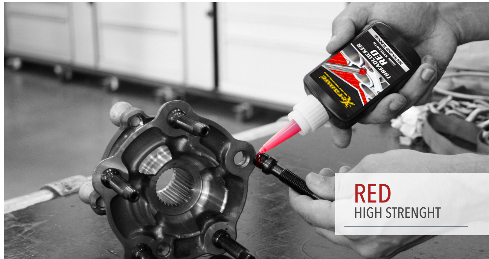
RED HIGH STRENGTH