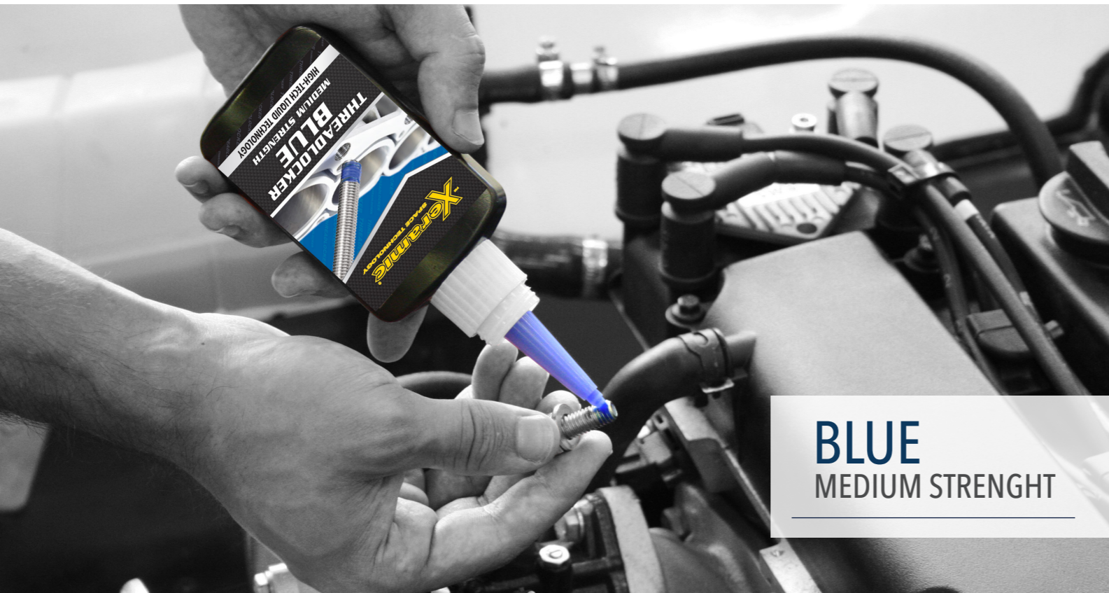
BLUE MEDIUM STRENGTH